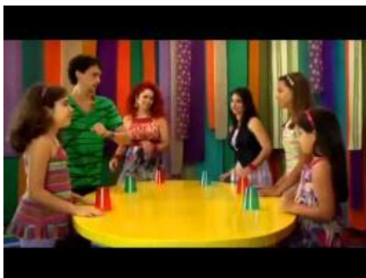
Imagem da atividade.

Vamos ouvir a música, "PALAVRAS CANTADAS, COMO FAZER ABC DOS COPOS".